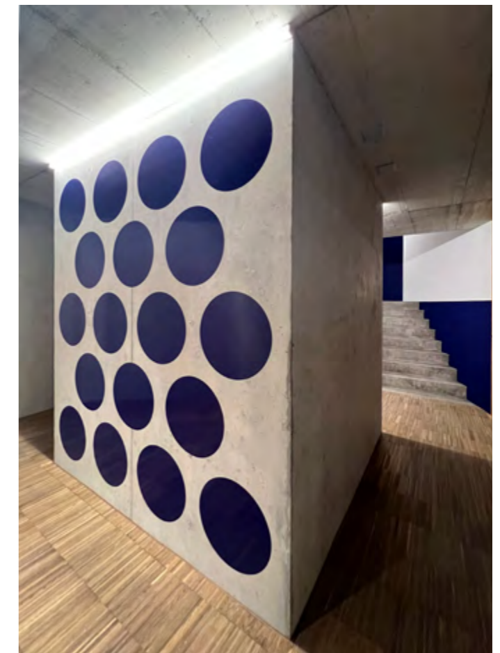
ICONS 2021 / 2022 Überbauung Rigiblick, Walchwil Chalet5: Kunst am Bau, Orientierungs- und Farbkonzept; Zusammenarbeit mit Burkhalter Sumi Architekten, Zürich Marianne Burkhalter und Christian Sumi; Private Bauherrschaft